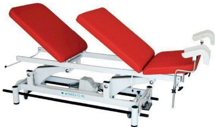
Table MONDIALE MÉDGYNECO