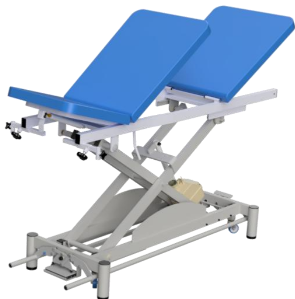
TABLE SIMPLEX LUXE MEDGYNECO