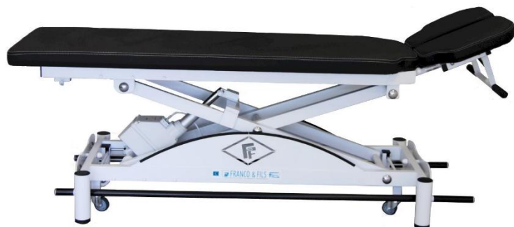
Table SIMPLEX LUXE OSTÉO CONFORT