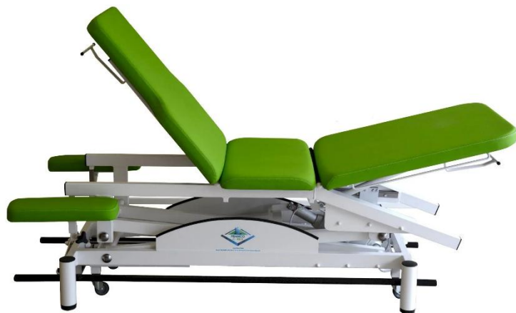
Table SIMPLEX LUXE MULTIPRODECLIVE