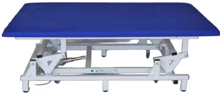
TABLE de BOBATH ELECTRIQUE (2 m X 1 m)