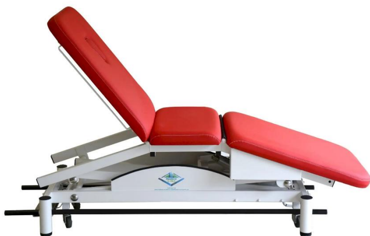
Table SIMPLEX LUXE MULTIPOSITIONS 2 DOSSIERS