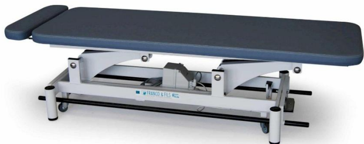
Table MONDIALE PLAN SIMPLE