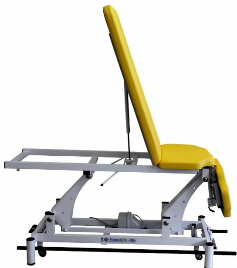
Table MONDIALE MANUOSTÉO