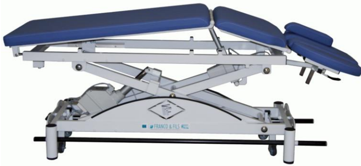
Table SIMPLEX LUXE OSTÉO CYPHOSE