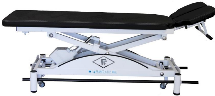
Table SIMPLEX LUXE OSTÉO CONFORT Tête écartable