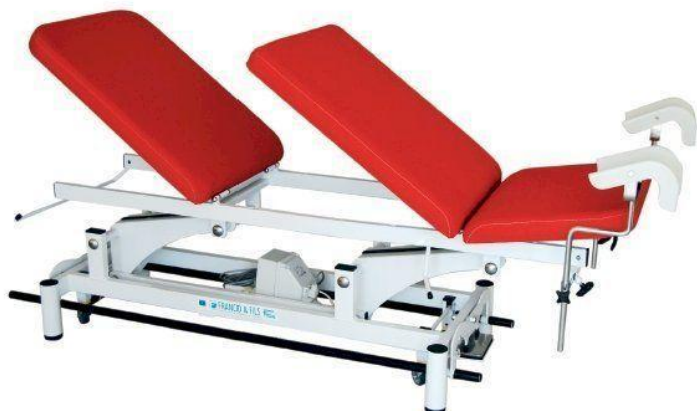
Table MONDIALE MÉDGYNECO