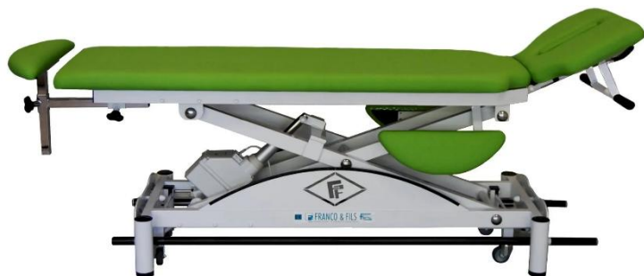
Table SIMPLEX LUXE OSTÉO CONFORT LUXE