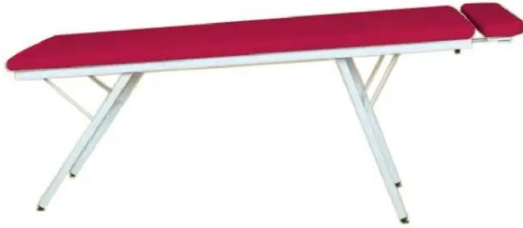
TABLE de Manipulation 3 Hauteurs + Repose Tête