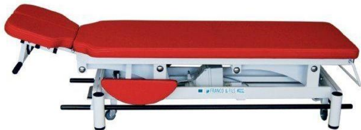
Table MONDIALE OSTÉO CONFORT