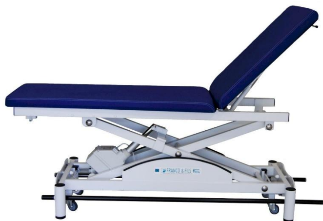
Table SIMPLEX LUXE