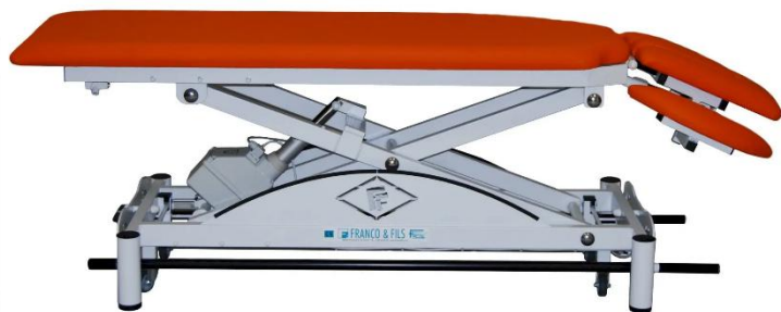
Table SIMPLEX LUXE OSTÉO SUPER Tête + accoudoirs