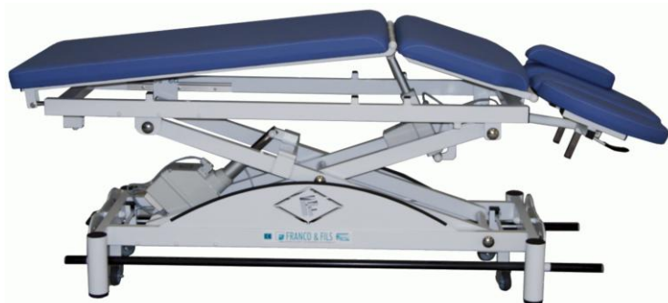
Table SIMPLEX LUXE OSTÉO CYPHOSE