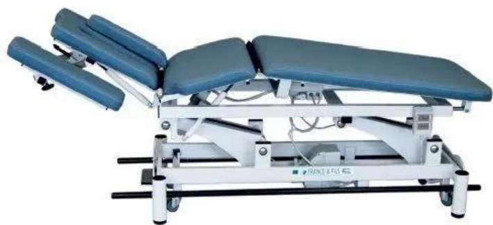
Table MONDIALE T.P.E.