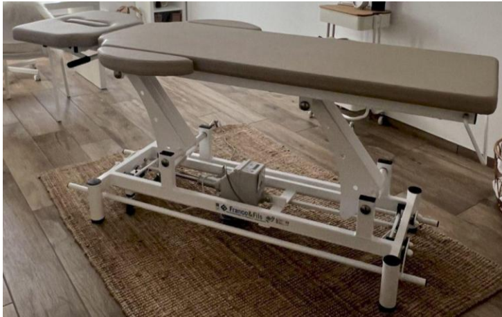
Table MONDIALE OSTÉO CONFORT LUXE