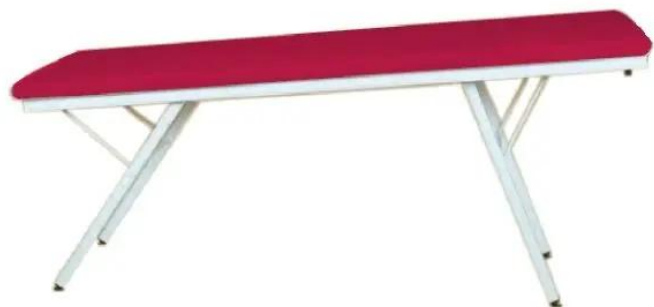
TABLE de Manipulation 3 Hauteurs